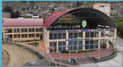
POLIDEPORTIVO Y GYM